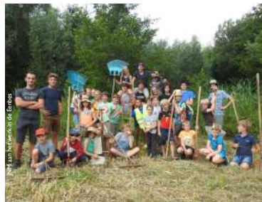
NH aan het werken in de Eenbes

Nu is het beheer gericht op voorjaarsbloeiërs en vlinders . Zo passen we het Sinusbeheer toe op de graslanden. Een bijzondere maatechniek waarbij in fases en via een kronkelende lijn gemaaid wordt.