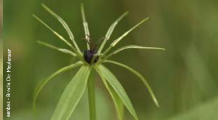
eenbes - Brecht De Meulenaer