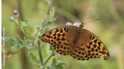
keizersmantel - Tom Vermeulen