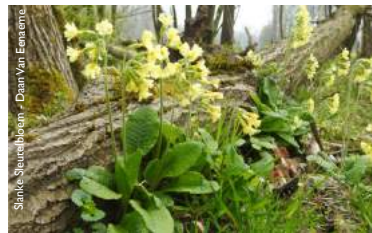
Slanke sleutelbloem - Daan Van Eenaeme

Nog een vaak voorkomende bloeier is de slanke sleutelbloem . Deze lentebloeier is een middelhoge plant met een gele bloemkleur die vanaf april bloeit. De soort is een echte bosplant die zicht het best voelt in vochthoudende, vrij natte standplaatsen.