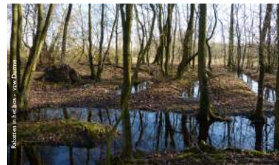
Rabatten in het bos - vzw Durme

Ook de buizerd is een vaak geziene gast in de Eenbes. Deze roofvogel vindt als geen ander in dit gebied voldoende voedsel: veldmuizen, mollen of konijnen vormen het hoofdmaal, samen met kikkers en kleine vogels. Diep verborgen in de Eenbes brengt hij zijn jongen groot. Vaak verraad zijn 'gemiauw' zijn aanwezigheid.