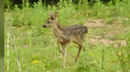
reuzejf - Daan Van Eenaeme