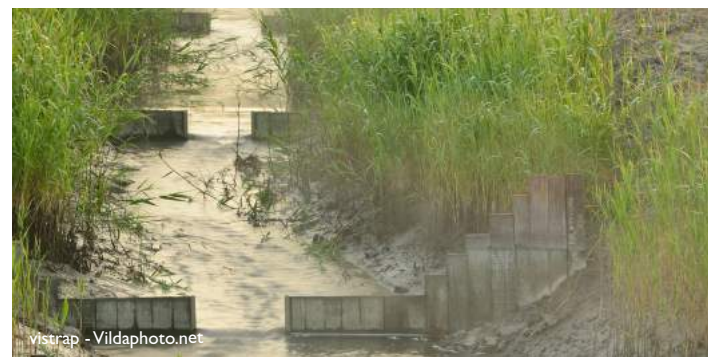
vistrap - Vildaphoto.net

En met succes! Heel wat bijzondere soorten werden hier reeds gespot. Ontdek hier welke.