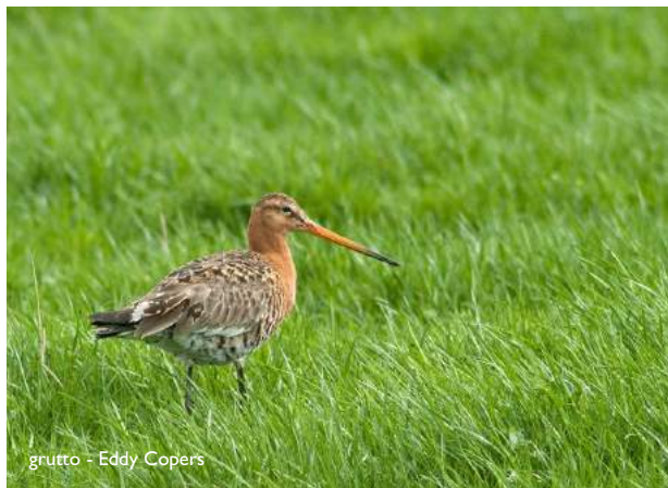
grutto - Eddy Copers

Deze vogels maken hun nesten in het gras van hooilanden. Het beheer van de Scheldebroecken stelt het maaien daarom uit tot laat in het voorjaar, precies om hen de tijd te geven om hun nestje te bouwen en hun jongen groot te brengen.