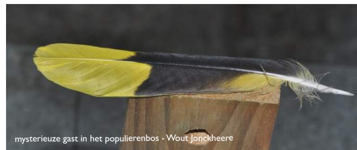
mysterieuze gast in het populierenbos - Wout Jonckheere

Tijdens een draai van 360° krijg je heel wat verschillende natuurtypes te zien. Het lijkt hier rustig, en je ziet het niet altijd, maar de natuur is continu druk bezig. Zo huist er in het populierbos een schaars geworden gast en de lisdodde is wel écht een manusje-van-alles.