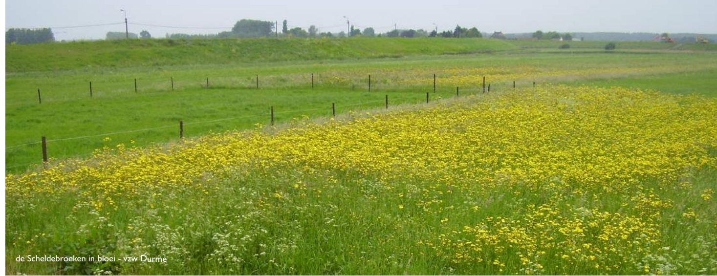
de Scheldebroecken in bloei - vzw Durme

De wandeling vertrekt aan 't Oud Brughuys (Brugstraat 55, Berlare), maar inpikken kan je overal. Veel plezier!