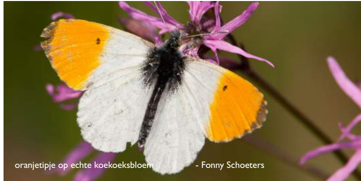
oranjetipje op echte koekoeksbloem - Fanny Schoeters